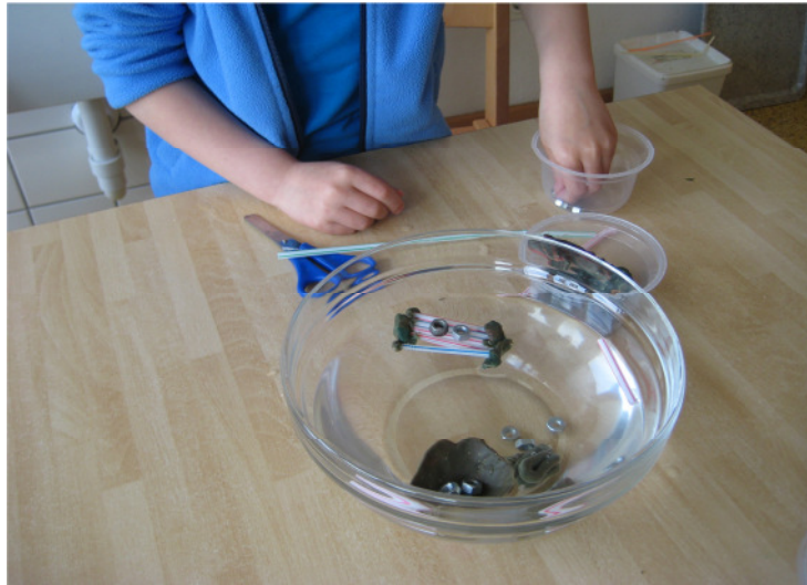
„Was schwimmt, was schwimmt nicht“