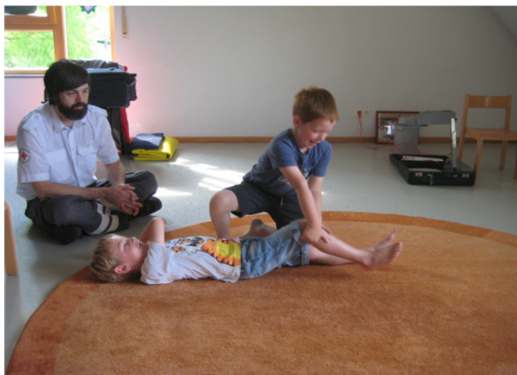
„Trau-dich-Kurs: Stabile Seitenlage“