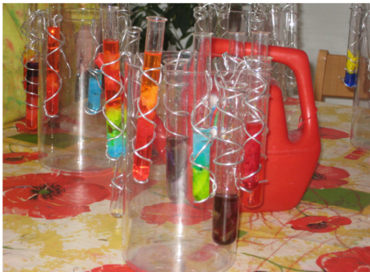
„Wir mischen Farben im Reagenzglas“