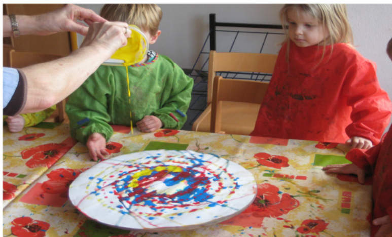
„ Fliehkraft erleben mit dem Drehteller“